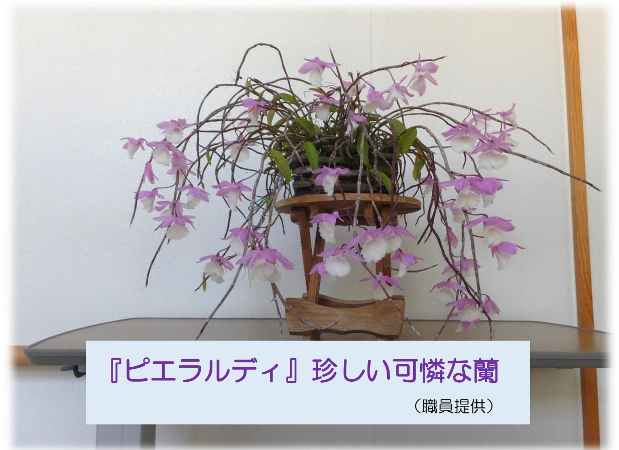
『ピエラルディ』珍しい可憐な蘭