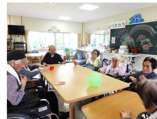
レクリエーション中～ボール遊び～