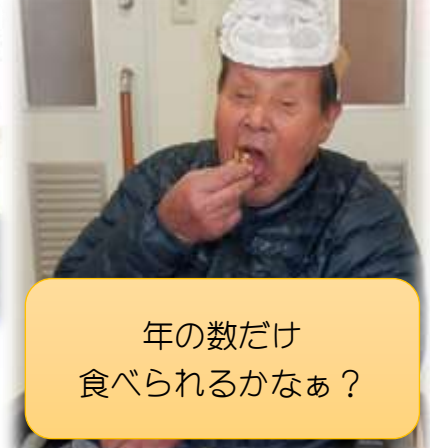
年の数だけ 食べられるかなあ？