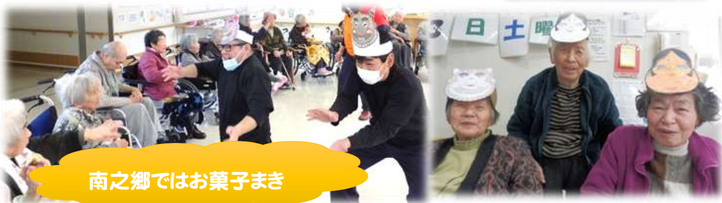
南之郷ではお菓子まき