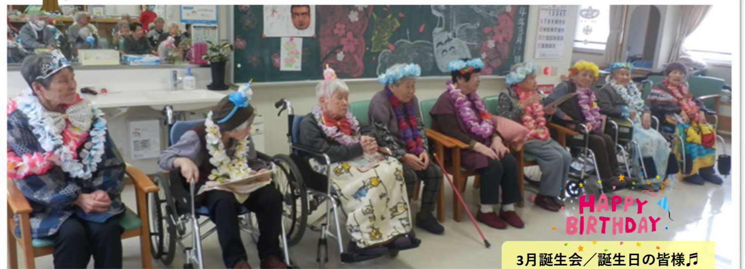
3月誕生会／誕生日の皆様♪