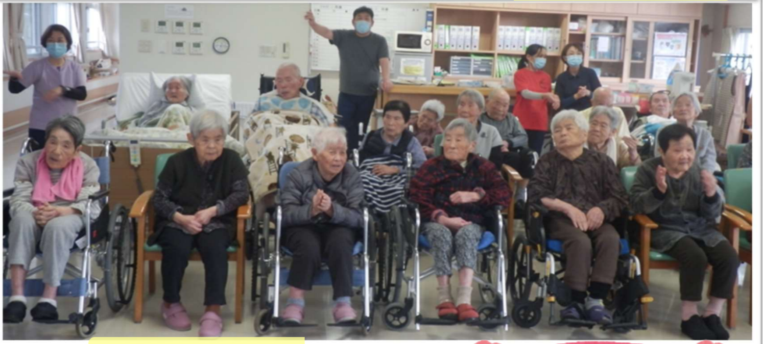
3月誕生会／参加の皆様♪