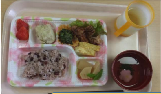
開設記念日のお弁当です。