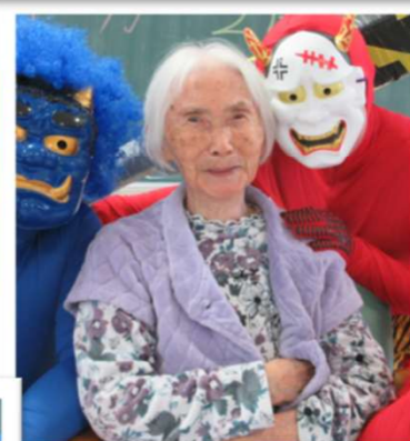
豆まきのあとは、鬼さんと記念撮影