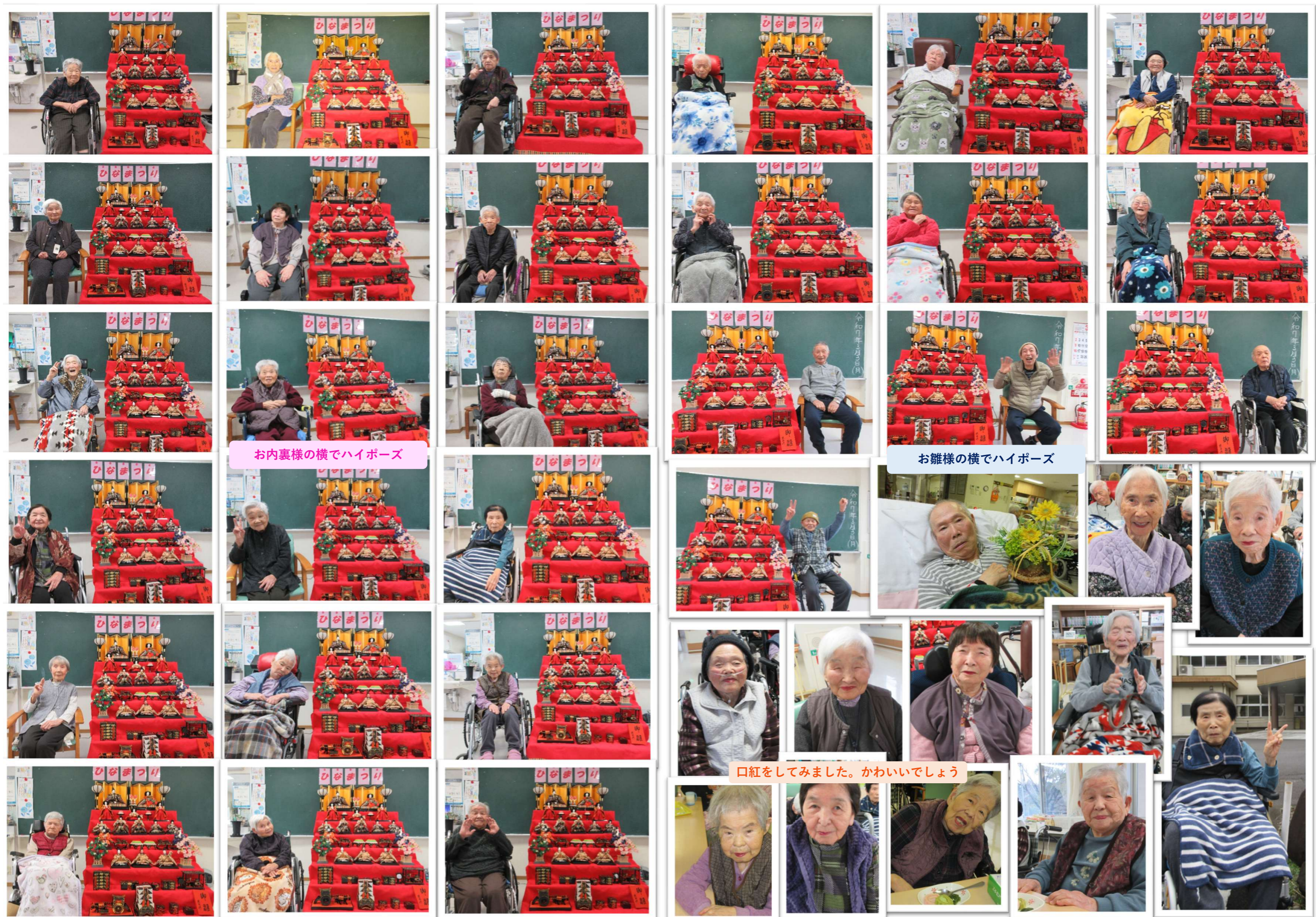
お内裏様の横でハイポーズ