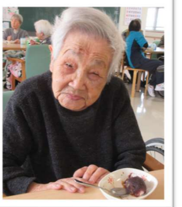
彼岸のぼたもち。うんめかったど〜